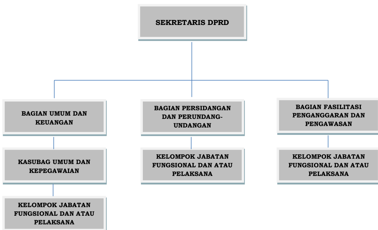
Gambar 1. Struktur Organisasi Sekretariat DPRD Kab. Tanah Datar