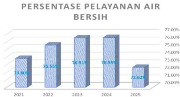
Grafik 3. Persentase Pelayanan Air Bersih Tahun 2021-2025

Pelayanan air bersih terus meningkat setiap tahunnya, akan tetapi di Tahun 2025 terjadi penurunan. Hal ini disebabkan karena adanya efisiensi anggaran dan laju pertumbuhan penduduk yang cukup tinggi.. Pada akhir periode Renstra ditarget 84,72% dari jumlah rumah tangga sudah memiliki akses air bersih.