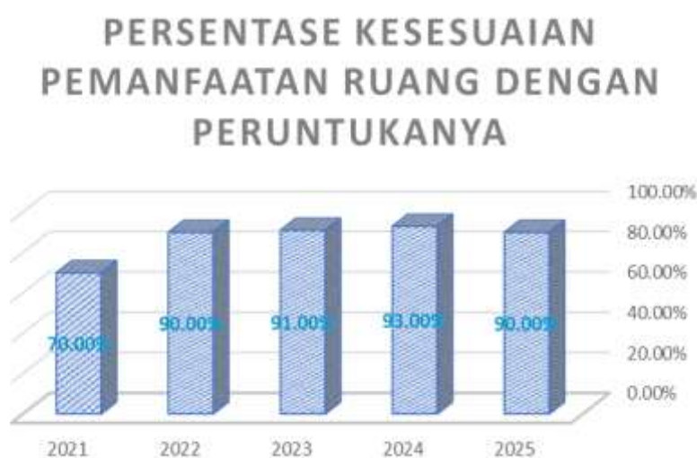
Grafik 5. Persentase Kesesuaian Pemanfaatan Ruang Dengan Peruntukannya

Persentase kesesuaian pemanfaatan ruang dengan peruntukannya cenderung meningkat setiap tahunnya. Masih adanya pemanfaatan ruang yang tidak sesuai dengan peruntukannya, pada tahun 2025 terjadi penurunan pada capaian indikator ini. Untuk mencapai target dilakukan sosialisasi Rencana Tata Ruang Wilayah (RTRW) secara berkelanjutan.