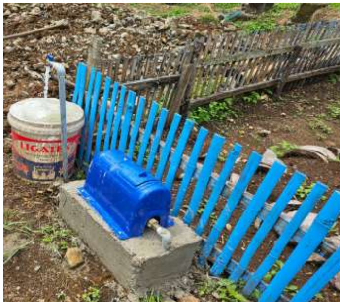
Sambungan Rumah SPAM