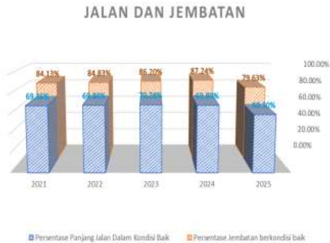
Grafik. 1. Persentase Panjang Jalan Dalam Kondisi Baik Tahun 2021-2025

Dari grafik diatas dapat dilihat bahwa jalan berkondisi baik cenderung naik setiap tahunnya. Akan tetapi pada Tahun 2025 terjadi penurunan 9,59 %, hal ini disebabkan karena curah hujan yang tinggi dan terjadinya bencana alam banjir bandang dan longsor mengakibatkan kerusakan prasana dan sarana jalan. Target panjang jalan berkondisi baik pada akhir periode Renstra (Tahun 2026) adalah 80%. Dalam kurun waktu 2 (dua) sampai akhir periode Renstra, Dinas Pekerjaan Umum akan berupaya untuk meningkatkan kondisi jalan dan mempertahankan kondisi jalan baik sehingga panjang jalan berkondisi baik pada Tahun 2026 yaitu sepanjang 910.928 KM.