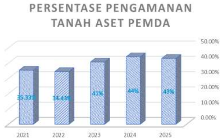
Grafik 7. Persentase Pengamanan Tanah Aset Pemda

Untuk mengamankan tanah asset Pemda, dilakukan sertifikasi tanah asset Pemda secara bertahap. Jumlah tanah asset Pemda yang bersertifikat naik setiap tahunnya. Pada Tahun 2025 terjadi penurunan persentase karena bertambahnya jumlah tanah asset Pemda.