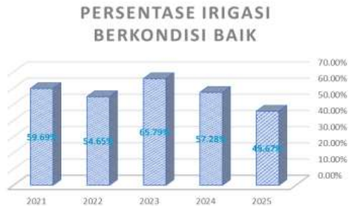
Grafik 2. Persentase Irigasi Berkondisi baik Tahun 2021-2025

Kondisi irigasi cenderung turun naik setiap tahunnya. Hal ini karena kondisi irigasi sangat dipengaruhi oleh curah hujan. Curah hujan yang tinggi menyebabkan terjadinya luapan sungai yang mengakibatkan kerusakan prasarana dan sarana irigasi, terutama terjadinya banjir lahar dingin dan banjir bandang pada Tahun 2024 dan 2025.