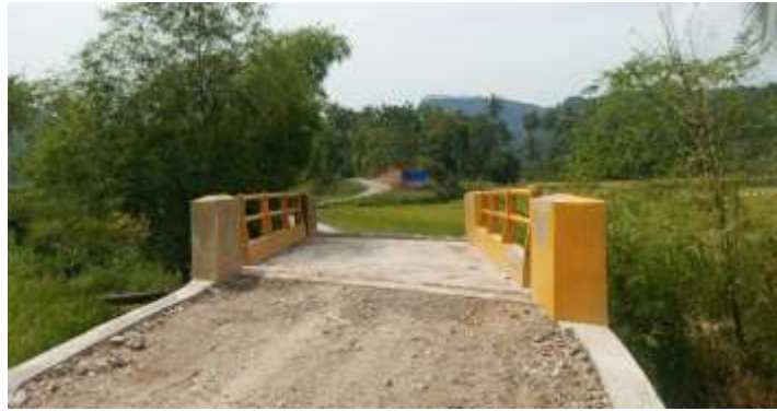
Jembatan Cocang Nagari Padang Ganting