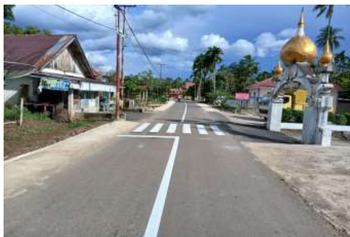
Ruas Simp Tigo Jangko - Bts Kab Sijunjung Kec Lintau Buo