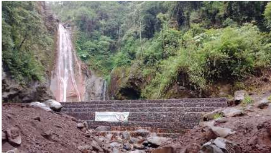
D.I. Bandar Basiku