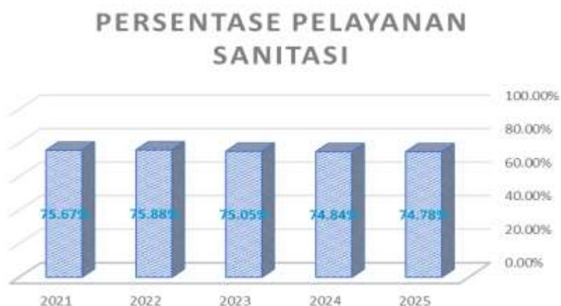
Grafik. 4. Persentase Pelayanan Sanitasi Tahun 2021-2025

Untuk layanan sanitasi terjadi penurunan setiap tahunnya karena laju pertumbuhan yang cukup tinggi.